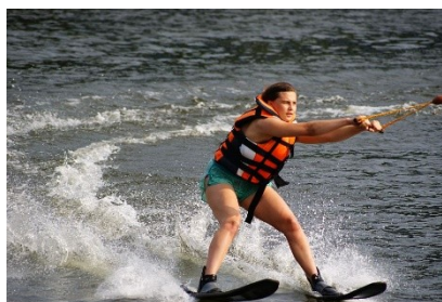
Narty wodne za motorówką