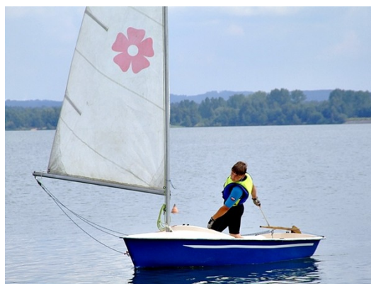
Żaglówki typu "MAK"